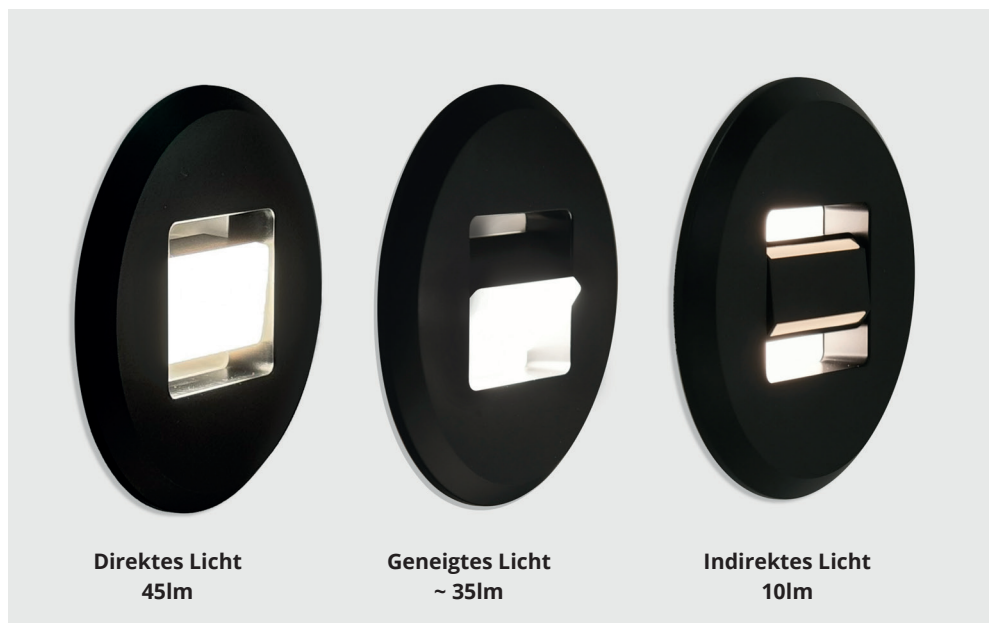
Direktes Licht 45lm

Installation 2: Ziehen Sie die Schrauben fest, um die Klemmen an der Verbindungsbox zu arretieren.